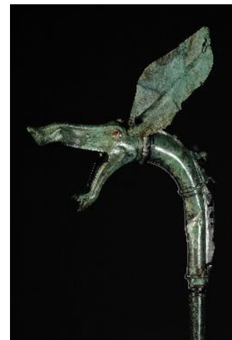
Carnyx sanglier détail