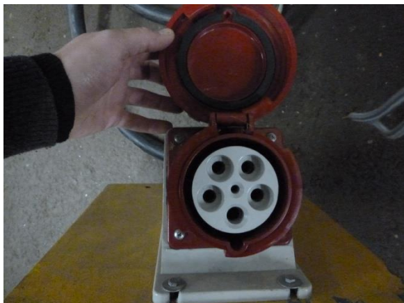
PC P17 125 A triphasé (3 Phases-Neutre-Terre)