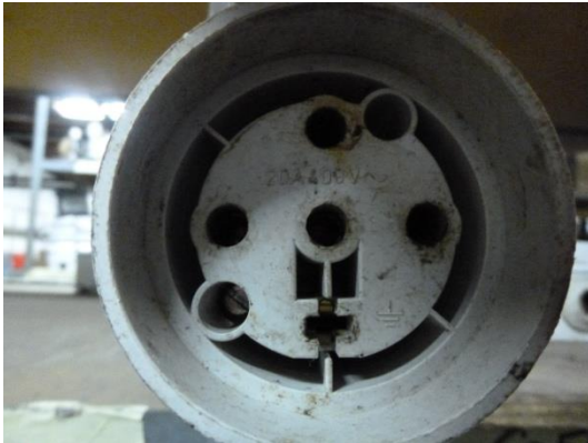
PC 20 A classique triphasé 5 pôles (3 Phases-Neutre-Terre)