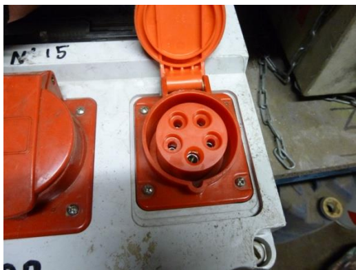
PC P17 16 A triphasé (3 Phases-Neutre-Terre)