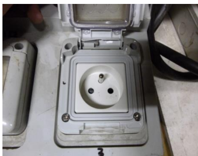
PC 16 A* classique (Phase-Neutre-Terre)