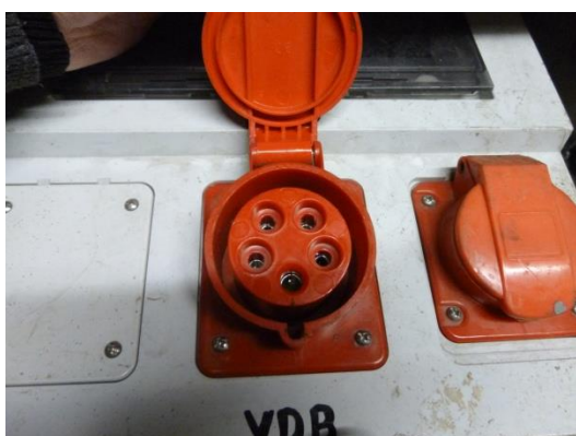
PC P17 32 A triphasé (3 Phases-Neutre-Terre)

La taille de la prise est plus importante que la 16 A