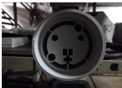
PC 20 A classique (Phase-Neutre-Terre)