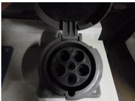
PC P17 63 A Triphasé (3 Phases-Neutre-Terre)