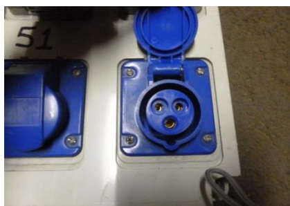
PC P17 16 A monophasé (Phase-Neutre-Terre)