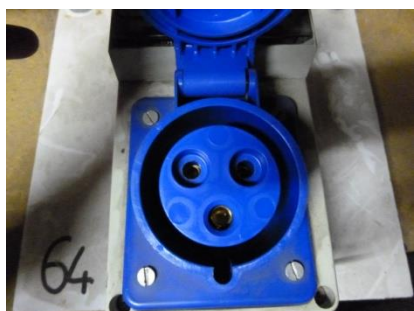
PC P17 32 A monophasé (Phase-Neutre-Terre)