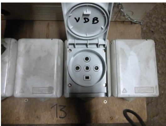
PC 32 A classique triphasé 5 pôles (3 Phases-Neutre-Terre)