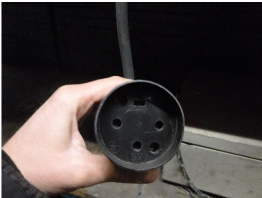
PC 20 A classique triphasé 4 pôles (3 Phases-Terre)