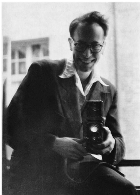
Photographie Adolfo Kaminsky

Postez-la sur votre compte, en mode public, en identifiant @museeedmondmicheletbrive et @igerscorreze, et en utilisant le #similikaminsky. Tentez de gagner un des lots proposés et peut-être serez vous-même exposé !