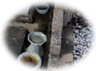
Cycle du moustique