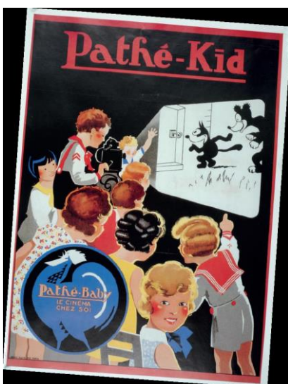
Affiche publicitaire Pathé-Baby, Le cinéma chez soi . 1922. Henri Ploye, imp. Paris, réédition : collection Serge Zreik, édition du Centre Georges-Pompidou et Flammarion, 1994, droits réservés, réimpression Mussot.