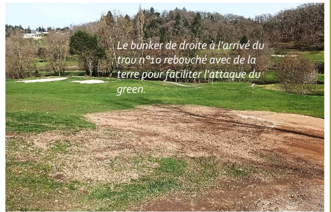
Le bunker de droite à l'arrivé du trou n°10 rebouché avec de la terre pour faciliter l'attaque du green.