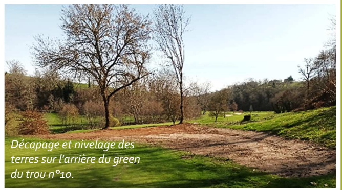
Décapage et nivelage des terres sur l'arrière du green du trou n°10.

L'équipe des jardiniers accompagnée d'un agent des Espaces Verts continue les travaux sur le parcours.