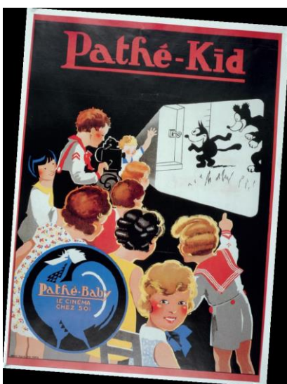
Affiche publicitaire Pathé-Baby, Le cinéma chez soi . 1922. Henri Ploye, imp. Paris, réédition : collection Serge Zreik, édition du Centre Georges-Pompidou et Flammarion, 1994, droits réservés, réimpression Mussot.