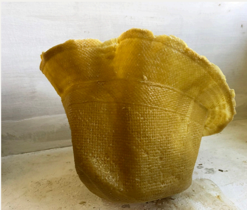
Coup de chapeau

Elle est fascinée par sa texture, sa couleur, sa lumière et son odeur. Sculptrice, elle réalise des œuvres en volume et des installations qui prennent place dans l'espace où la cire est souvent prédominante, seule ou en dialogue avec des objets et des éléments naturels. Ses trois petites sculptures en cire qui évoquent des objets ou des outils seront stratégiquement présentés dans différentes vitrines de la collection permanente.