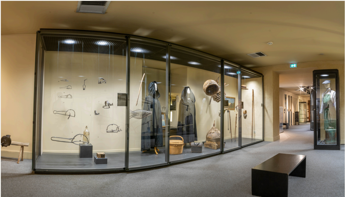
Vue de la salle Turgot et des collections d'apiculture

Son ancrage dans son territoire l'a doté en outre de collections ethnographiques régionales collectées dans les années 1960-70 par des conservatrices au fait des recherches de l'époque.