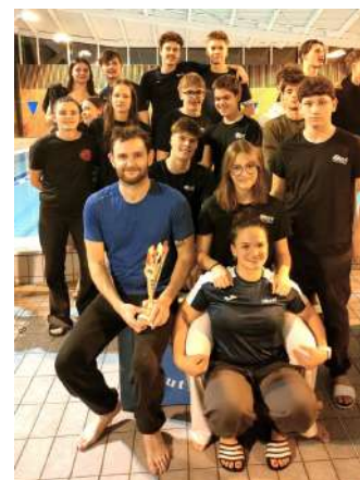
Les équipes 1 féminine et masculine aux Interclubs

Les 6 équipes engagées totalisent 52 303 points ce qui permet au CNB de se classer provisoirement 106 ème / 640 au niveau national et 6 ème /61 au niveau régional.