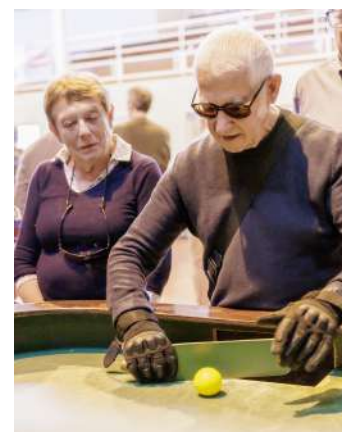
Démonstration de Showdown

Le pôle deviendra ainsi une référence pour la Corrèze, qui se dotera d'autres structures sur Tulle et Ussel afin de couvrir l'ensemble des territoires du département.