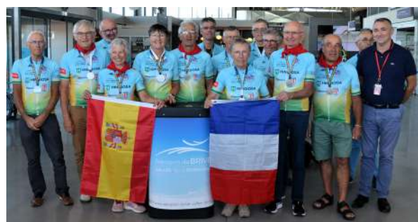
L'accueil à l'aéroport de Brive Vallée de la Dordogne

Quatorze cyclistes du Cyclo-Randonneur Briviste (CRB) vont prendre le départ depuis Beynat pour un voyage à vélo en direction de la ville de Cadix en Espagne.