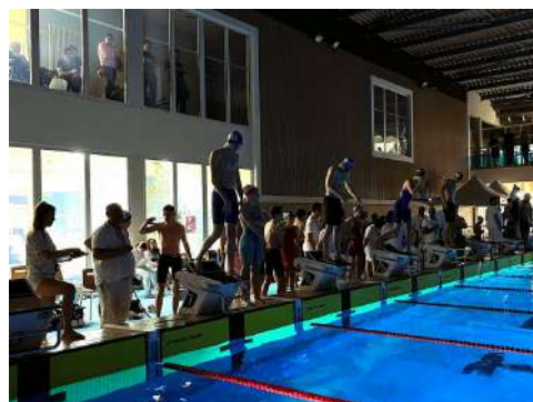
Les relais nocturnes au Meeting de la Ville de Brive

Le public briviste est attendu nombreux pour encourager nos nageurs par leur présence et leurs voix.