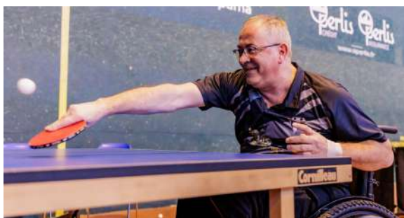
Tennis de table

Il s'inscrit dans la continuité des actions menées par l'association Handisport Corrèze et permet de proposer un lieu accessible, structuré et adapté à la pratique régulière de plusieurs disciplines, notamment la sarbacane, la boccia, le tennis de table, le showdown* ou encore des activités multisports.