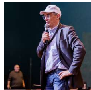
C. DEBIEUVRE

Ce pôle est ouvert depuis le 16 octobre à l'ensemble des publics concernés par la Fédération Française Handisport, qu'ils soient atteints de handicaps moteurs ou sensoriels, garantissant ainsi une offre adaptée et complète sur le territoire.