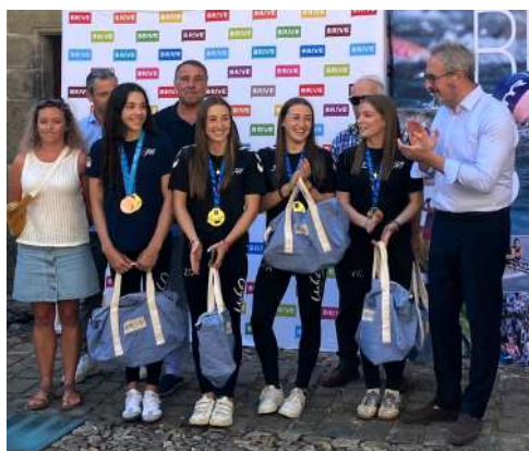
L'équipe lors de la cérémonie des champions du 5 juillet dernier