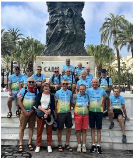
Cadix : terme du voyage

Et comme si ce partenariat devait se justifier, le dernier jour de route, le dernier repas de midi, le patron du restaurant était intrigué par les logos Hinojosa de notre minibus, puis par nos maillots, il nous demande ce que c'est : on lui parle de l'entreprise, de son aide et il nous dit : "c'est aussi mon nom de famille !!!!"